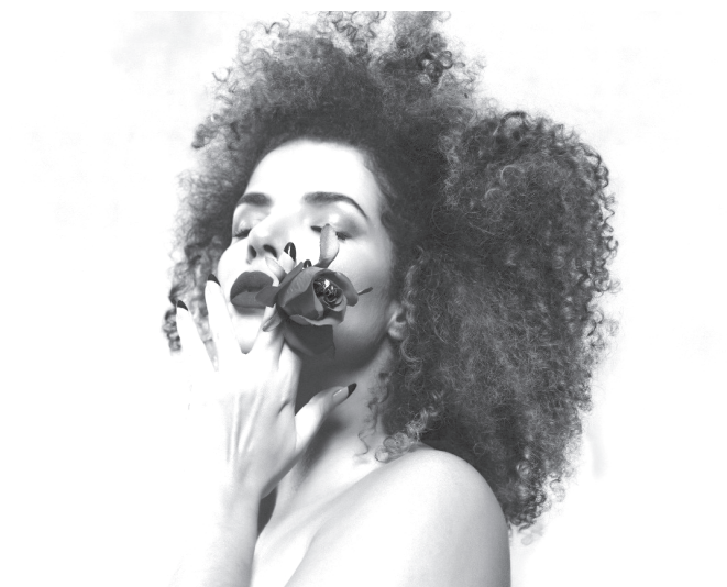
MÚSICA A cantora Vanessa da Mata é atração confirmada

querem chamar a atenção para a preservação de toda a fauna e a flora da Chapada Diamantina, destacando as medidas e os cuidados que devem ser seguidos para evitar assoreamento, fogo ou qualquer tipo de devastação da natureza. O festival também volta a promover a campanha Bahia Sem Fogo contra as queimadas que atingem a Região da Chapada da Diamantina. Durante as apresentações, todos os artistas irão mobilizar a comunidade e convocar o público para ter muita atenção em jogar pontas de cigarros e utilizar velas e outros materiais inflamáveis perto da vegetação.