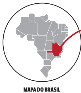
MAPA DO BRASIL