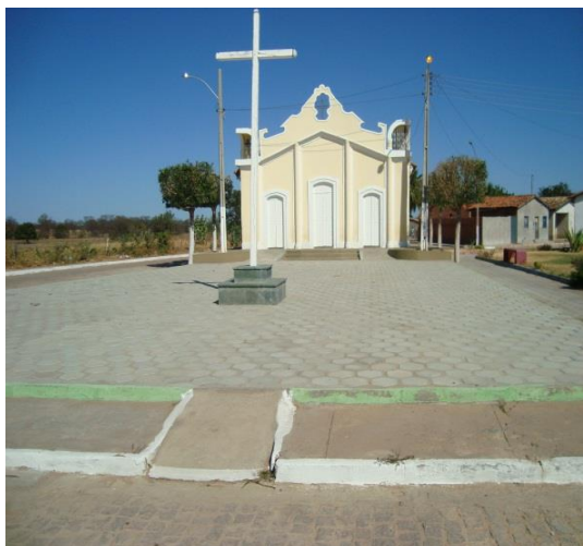
Foto 03- Igreja do Bom Jesus.