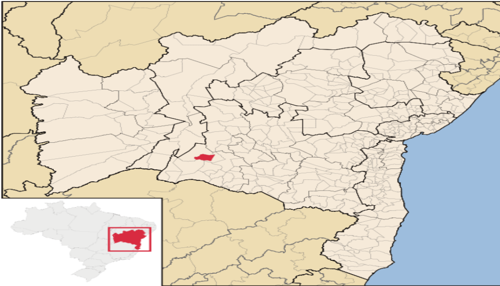
Foto: 05- Localização Geográfica de Matina-BA- IBGE (08 agost. 2010). Disponível em http://cidades.ibge.gov.br/Acesso em 27. Agost.2014.

Situada a 42 km de Guanambi, 87 km de Caetitê e 85 km de Palmas de Monte Alto, Matina liga a essas cidades pela BR- 030 e à Capital do Estado pela BR- 030; BR- 262 e BR- 324.