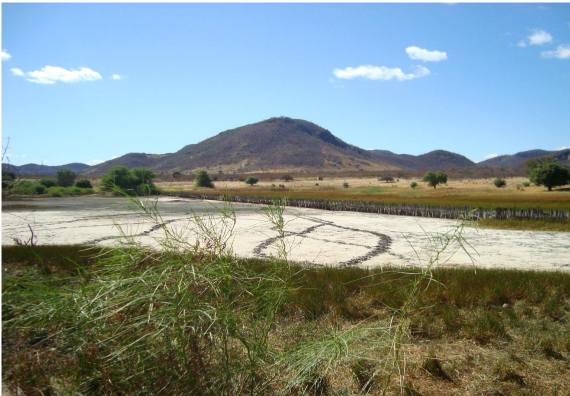
Foto 01- Lagoa do Sal.

Com base em alguns registros e segundo relatos dos moradores antigos, Matina foi iniciada por volta de 1850, encostada na Lagoa de Matina, onde se concentravam pessoas interessadas na exploração do sal em sua forma mais rudimentar.