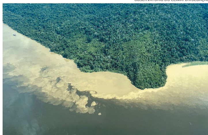
Mudança na cor do Rio Tapajós atingiu o chamado 'Caribe Amazônico'

TAPAJÓS A Polícia Federal concluiu que a mudança de cor nas águas do rio Tapajós em Alter do Chão, famoso destino turístico no Pará, foi provocada pelo garimpo ilegal e pelo desmatamento na região. O laudo da PF faz parte do inquérito que apura a mudança de coloração da água do Rio Tapajós, entre os municípios de Santarém e Itaituba, nas praias conhecidas como "Caribe amazônico".