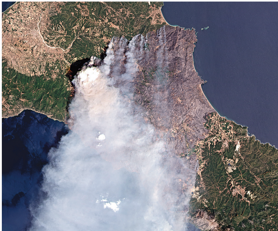
Foto aérea mostra a gravidade do incêndio na ilha de Evia, a segunda maior da Grécia. Cerca de 2 mil pessoas tiveram que deixar o local

representantes de 195 países, mostra uma avaliação científica dos últimos sete anos e “deve significar o fim do uso do carvão e dos combustíveis fósseis, antes que destruam o planeta”, advertiu Guterres, em comunicado.