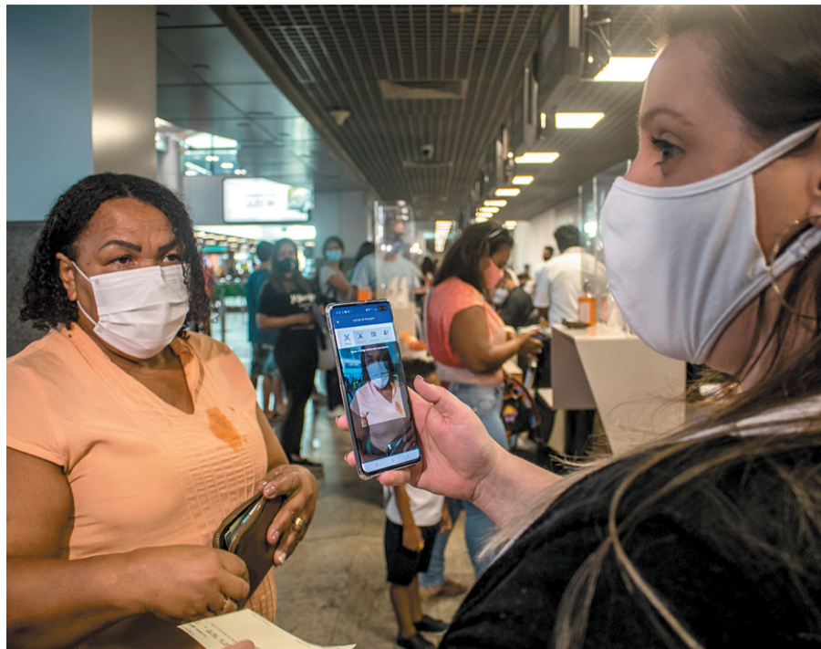
Resolução veta uso de lenços, bandanas e máscaras de acrílico nos aviões e aeroportos

A Agência Nacional de Vigilância Sanitária