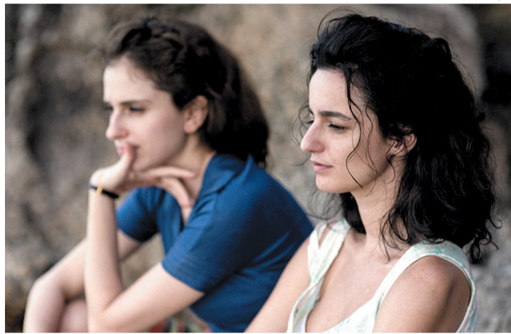
Em seguida, A Vida Invisível concorre com 14 indicações