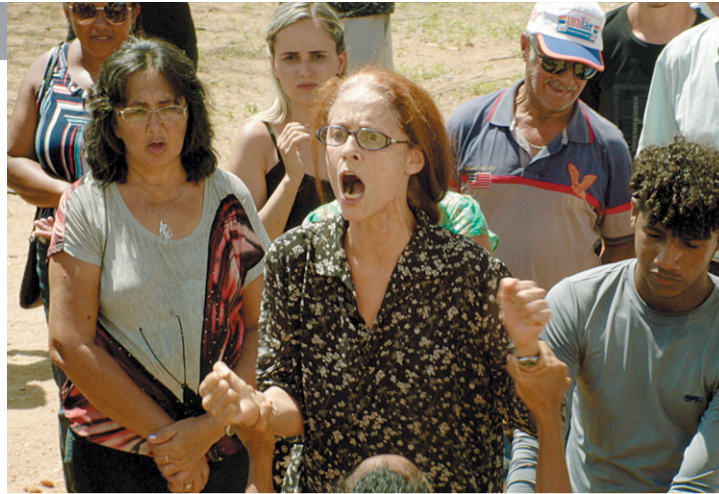
Bacurau é o filme com maior número de indicações: 15 categorias

A lista de finalistas reúne mais de 200 profissionais indicados, 35 longas-metragens brasileiros e 10 longas estrangeiros (21 de ficção, 8 documentários, 3 infantis, 3 de animação, 5 internacionais e 5 ibero-americanos). Ao todo, este ano também estão na disputa 15 curtas brasileiros (5 de ficção, 5 documentários e 5 de animação para TV paga, 5 documentários para TV paga, 5 ficção TV aberta). O Grande Prêmio de Cinema Brasileiro é votado por profissionais das mais diversas áreas do setor.