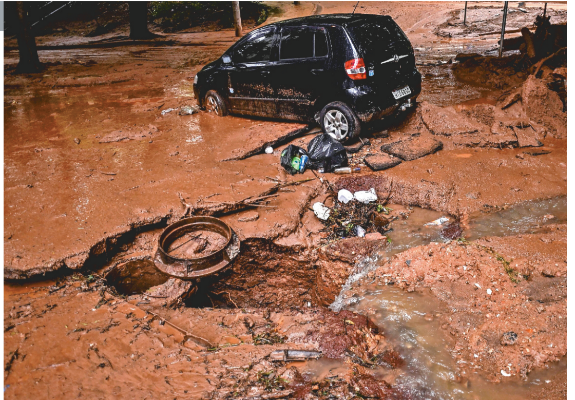
Avenidas foram destruídas e carros foram arrastados pela força da chuva em Belo Horizonte, capital de MG

lojados totalizou 44.929 e o de desabrigados, 8.529. Segundo o meteorologista do Inmet Olívio Bahia do Sacramento Neto, o volume acumulado de chuva em Belo Horizonte ainda não é o maior registrado no estado. Isso porque, em janeiro de 1991, a estação de Águas Claras registrou um total de 998,7 mm. Além disso, em 1961, em Montes Claros, foi registrada uma precipitação mensal de 956,6 mm. A ressalva, contudo, é que os dois maiores resultados dizem respeito aos totais registrados no fim dos meses de janeiro e, faltando ainda dois dias para o mês acabar, a previsão é de mais chuva pelos próximos dias. Ontem, houve mais chuva