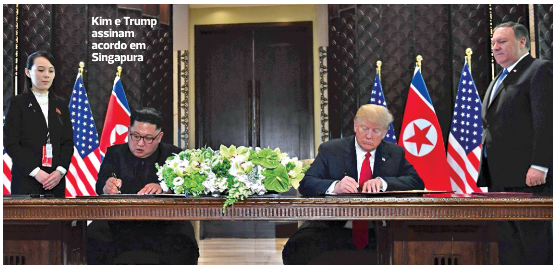
Kim e Trump assinam acordo em Singapura